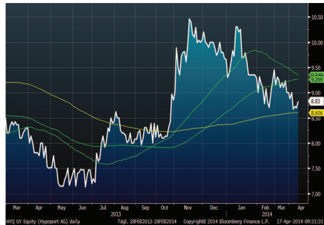
Kursverlauf mit 100-Tage und 200-Tage Linie